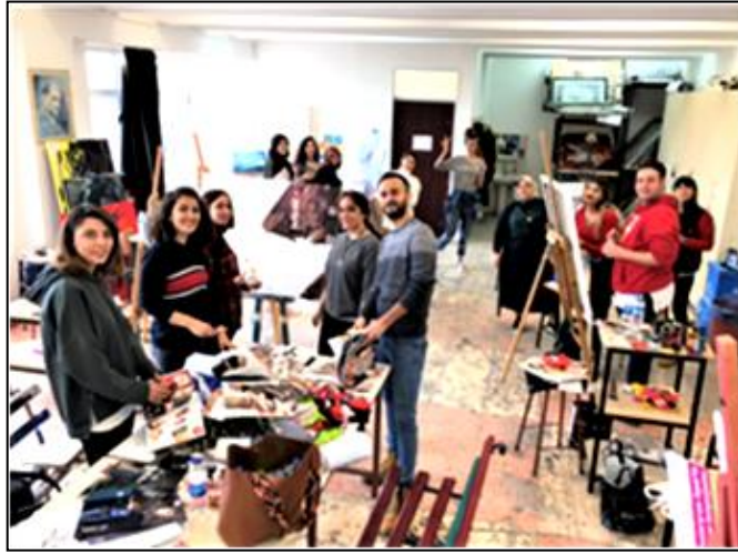
Resim 1 (Atölyede istasyonlarında çalışan öğrenciler)