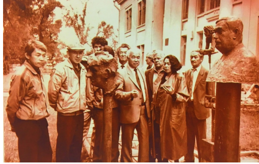
Görsel-4 “Akademi Hocaları Bir arada”