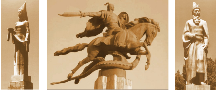
Görsel-2 “Manas Anıtı”